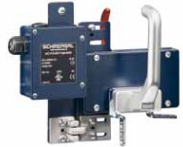
AZ 415 - Referencia: C-16AZ41