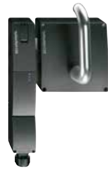
AZM 200 - Referencia: C-24AZM2