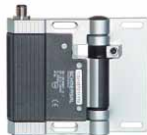
TV.S 410 - Referencia: C-56TVS4