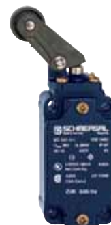
Z/T 335/336 - Referencia: C-12335