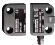
BNS 260 - Referencia: C-71BNS2