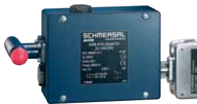
AZM 415 - Referencia: C-23AZM4