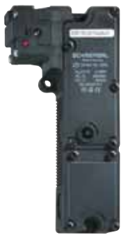
AZM 190 - Referencia: C-04AZM1