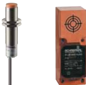
Referencia: Sensor de proximidad inductivo