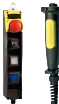
Referencia: BDF 200 / C-78ZSD