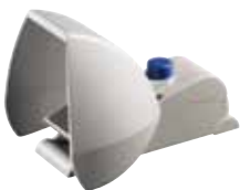
TFH 232 - Referencia: C-64TFH2