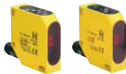
SLB 400 - Referencia: C-86SLB4