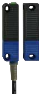
RSS 36 - Referencia: C-57RSS3