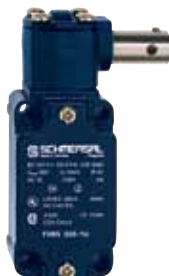
TV.S 335 - Referencia: C-34TV8S