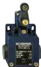
Z/T 255 - Referencia: C-07255