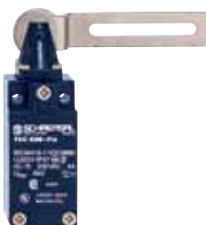
T.C 235/236 - Referencia: C-53TC23