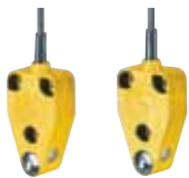
SLB 200 - Referencia: C-43SLB2