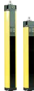
SLC 421 - Referencia: C-21SLC4