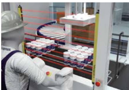
1) El tec.nicum desarrolla conceptos y soluciones para asegurar todas las zonas de peligro de instalaciones de producción y asesora a sus clientes independientemente de los fabricantes.