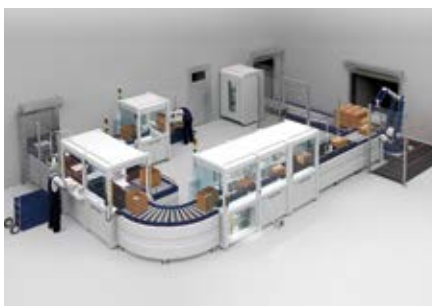
3) Para dispositivos de protección optoelectrónicos se ofrecen Safety Services especiales.

que también garantizan el mejor resultado posible, incluso desde el punto de vista económico. Para ello es aconsejable tener en cuenta el desarrollo de la solución técnica de seguridad adecuada desde la fase inicial, es decir, la proyección de la nueva instalación.