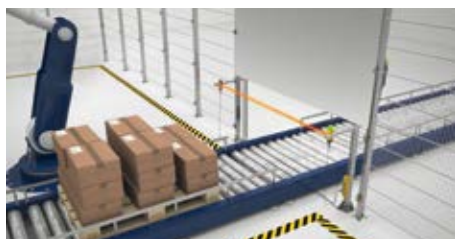
Registro de alturas