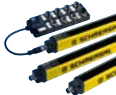
Cortinas ópticas SLC