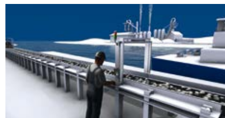
Largo alcance (High Range)